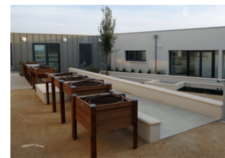
Le Jardin thérapeutique